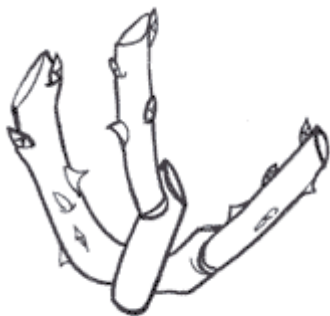
TAILLE DE ROSIER BUISSON (MARS)