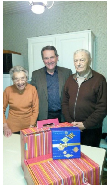
Monsieur et Madame Bourgeois

Mais pour patienter, nous vous proposons « un thé dansant » le samedi 11 avril 2015 après midi. Les invitations vont prochainement partir de la mairie, mais d'ores et déjà reprenez cette date.